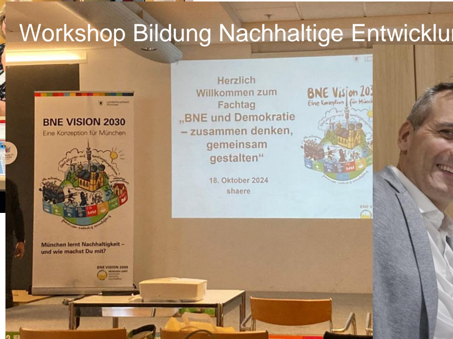
Workshop Bildung Nachhaltige Entwicklung