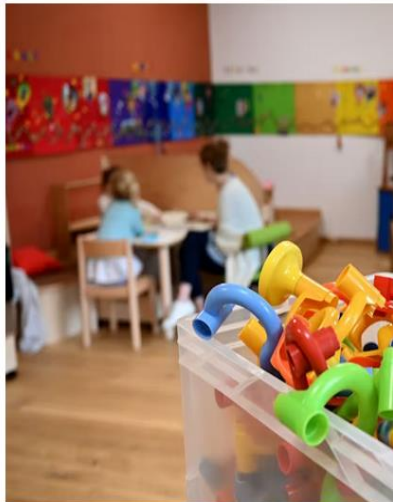
Alleinerziehende haben oft Probleme, einen dringend benötigten Kitaplatz zu bekommen.

17. Juli 2024, 17:15 Uhr | Lesezeit: 2 Min.