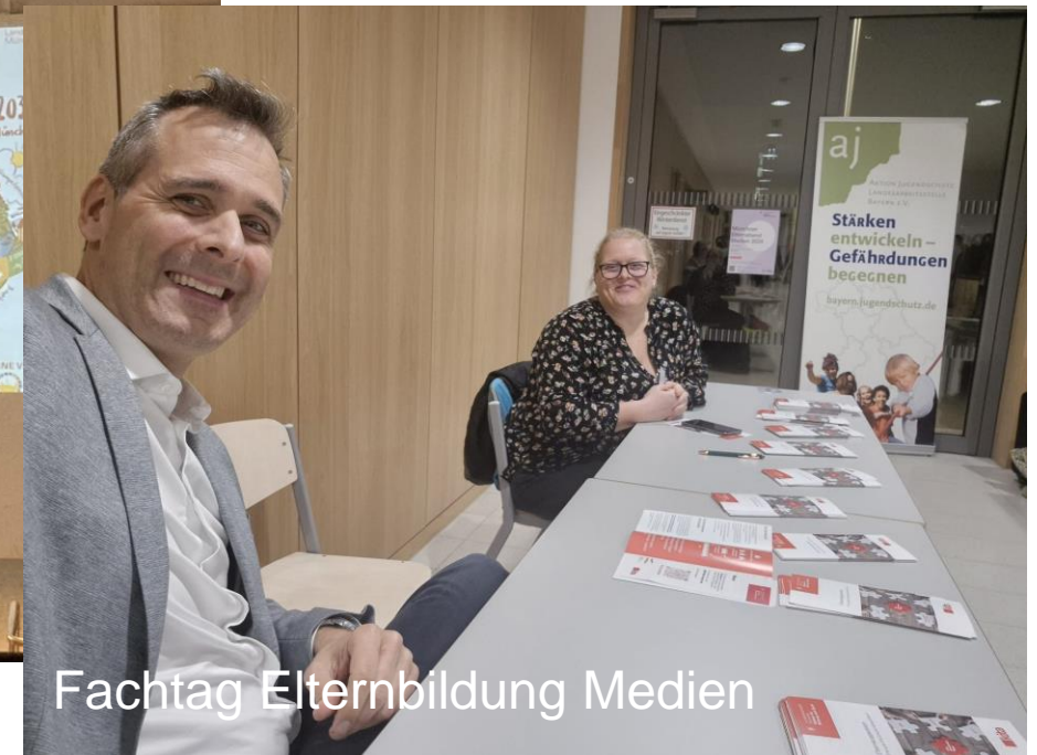
Fachtag Elternbildung Medien