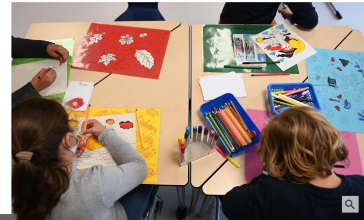
Auch am Nachmittag gut betreut: Kinder einer Ganztagschule in Berg am Laim.

13. März 2023, 17:22 Uhr | Lesezeit: 6 Min.