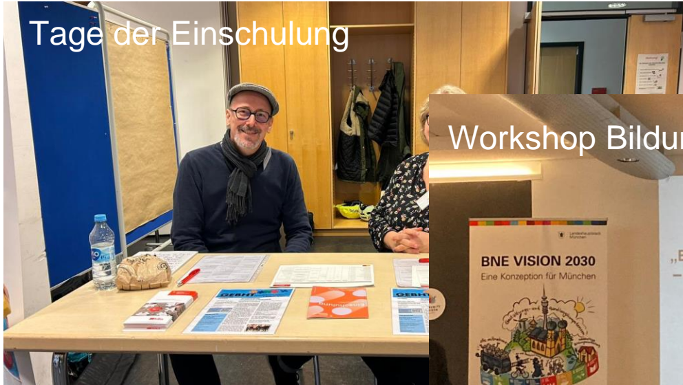
Tage der Einschulung